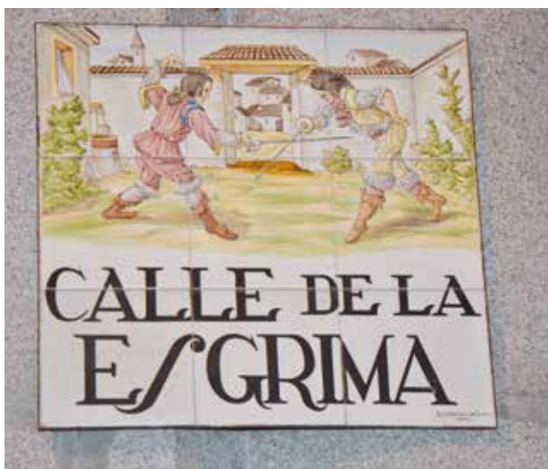
Azulejo de la calle de la Esgrima

huella en el Siglo de Oro. Pronto, veremos la imagen de un azulejo con dos caballeros batiéndose, es la calle de la Esgrima. Si continuamos por ella, localizaremos otra vía perpendicular: la calle de la Espada.