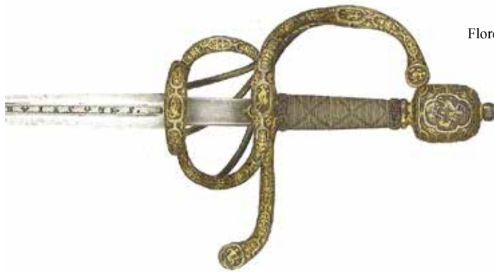
Florete español, 1585-1600 (1.104,7 cm)