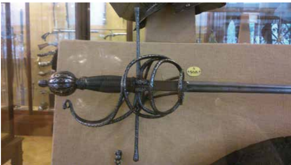
Espada con empuñadura de lazo