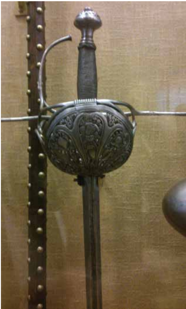
Espada con guarnición de concha

Un dato curioso a tener en cuenta es que cualquier espada que fuese llevada como complemento o acompañamiento ya era ropera, excepto las espadas de los militares, que se diferenciaban por tener una guarnición, o empuñadura, muy sencilla.