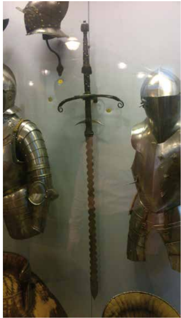
Mandoble alemán medieval

en el uso de la espada de grandes dimensiones a dos manos, quien, en el siglo XIV, escribió su Códice Nürnberger Handschrift GNM 3227 a . También hay que mencionar el posterior tratado anónimo del siglo XVI, conocido como el Códice Wallerstein , hoy en la Biblioteca de la Universidad de Augsburgo. Este último está considerado como el manual de las artes marciales occidentales. Se divide en tres partes, mostrando en cada una de ellas numerosas ilustraciones. En la primera parte se indican todas las armas blancas que se incluyen en el manual, como dagas, lanzas, puñales y espadas largas. En la segunda, se muestran las técnicas a desarrollar, dependiendo del arma a utilizar y que influirán en el modelo de lucha. La tercera parte explica las técnicas de lucha con armadura.