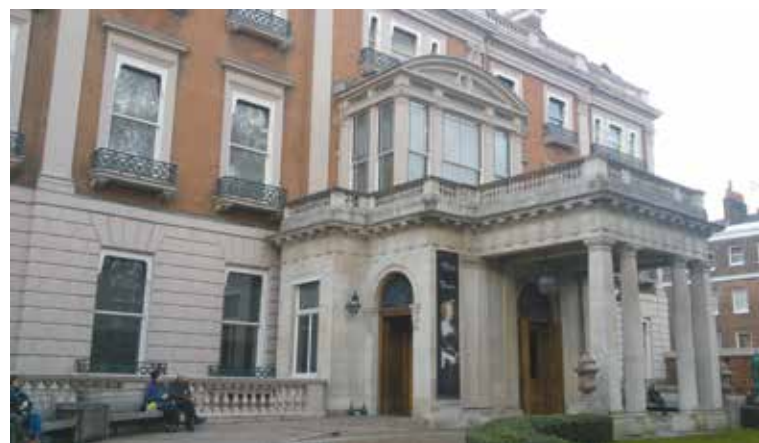
Wallace Collection de Londres donde existe una buena muestra de armas blancas