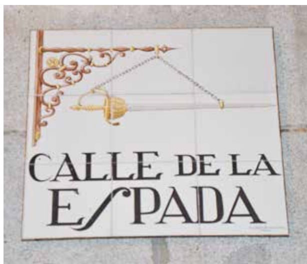
Azulejo de la calle de la Espada

Pero la academia tuvo problemas económicos que impedían pagar la renta. Un día, el arrendador, que quería