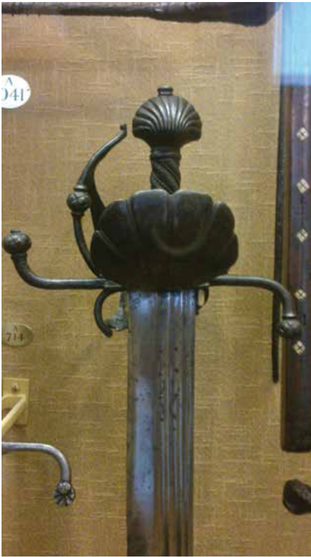
Espada alemana s XVII