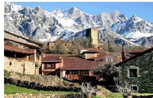
Imágenes correspondientes a la localidad de Potes, al monasterio de Santo Toribio de Liébana y a Mogrovejo

Viajar a Cantabria en verano es una maravilla. El clima es estupendo, los paisajes, espectaculares y sus pueblos, pintorescos. Por ello, os plateamos viajar con nosotros a su corazón más bello. Aquí os presentamos el recorrido que haremos y los lugares que visitaremos.