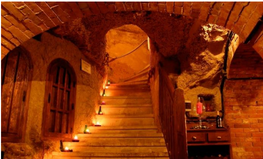
Bodega Don Carlos (Aranda de Duero)