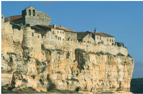
Vista de Rello (Soria)

(PUENTE DE LA ALMUDENA - Del 9 al 11 de noviembre de 2018)