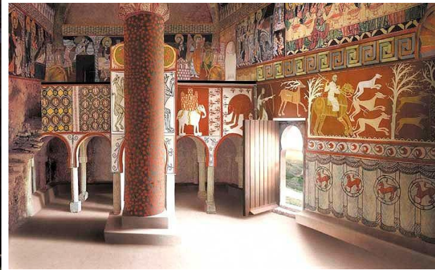
Ermita S. Baudelio de Berlanga (Soria)

Muy cerca de donde nos hallamos y de donde transcurre nuestro día a día encontramos lugares que podrían transportarnos al pasado con tan solo mirarlos. Paisajes dramáticos de pueblos cuyas casas se agolpan en el interior de su muralla medieval. Tal es el caso de Rello , localidad soriana que visitaremos. Portadas de templos románicos tan imponentes como San Miguel, en Caltojar. Patrimonio único y aún bastante desconocido, como el que nos ofrece la ermita mozárabe de San Baudelio de Berlanga.