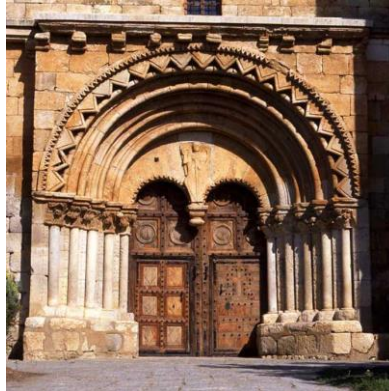
Iglesia de S. Miguel (Soria)