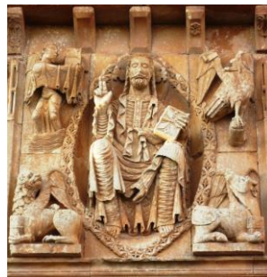
Iglesia de San Juan el Bautista (Moarves de Ojeda)