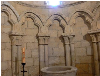
Iglesia de Nuestra Señora de la Asunción (Perazancas de Ojeda)

(PUENTE DE TODOS LOS SANTOS - Del 1 al 4 de noviembre de 2018)